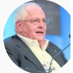
Martin Wolf Columnista del f

Una economía emergente como la colombiana tiene oportunidades para potencializar el valor de las biociencias a través de la generación de estrategias con opcionalidades tecnológicas.